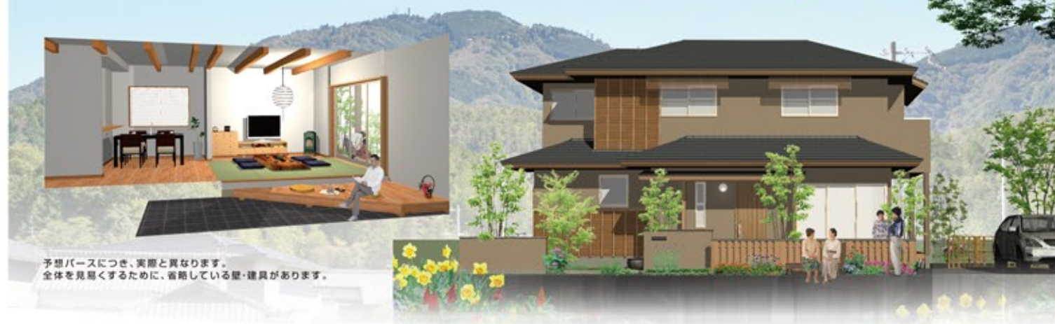
予想ベースにつき、実際と異なります。 全体を見届けるために、省略している壁・建具があります。

自然豊かなのんびりゆったりとした住宅 街です。西側にある小さな用水路沿い には、季節の野の花が咲いています。